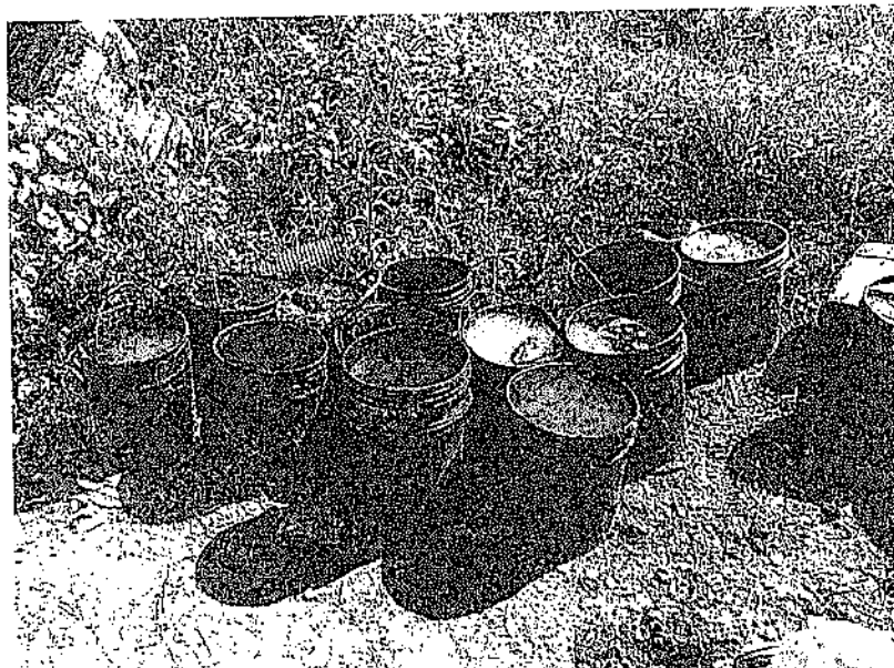
Foto 4. Recipientes abiertos e impregnados con aceites usados a la intemperie. Lugar: Parqueadero Las 24 Horas, barrio Manuela Beltrán, municipio de Soledad. Fecha: 17 de septiembre de 2018.